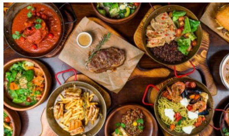
Table de bistrot